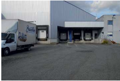
Les nouveaux entrepôts sur le site de Cardry

500 à 1 500 palettes et nous allons gagner en confort de travail notamment avec les quais de chargement en place". Dès le début de ce mois de mars le site sera opérationnel et une dizaine de salariés y travailleront.